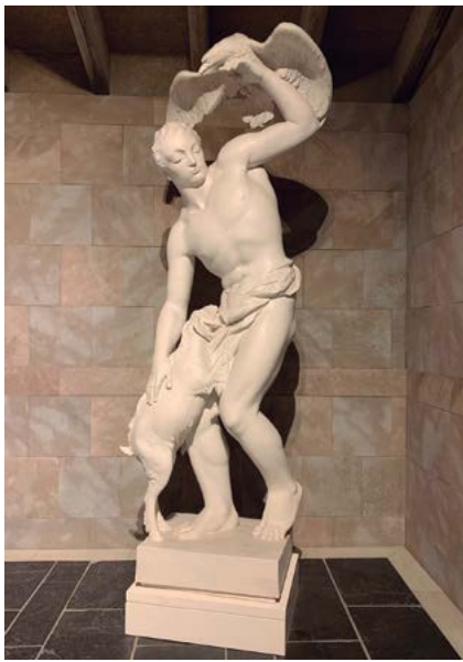
Pablo Gargallo El pastor de l'àliga 1928 Guix modelat 268 x 97,5 x 54,5 cm. Museu de la Garrotxa, Olot; núm. d'inventari 659.