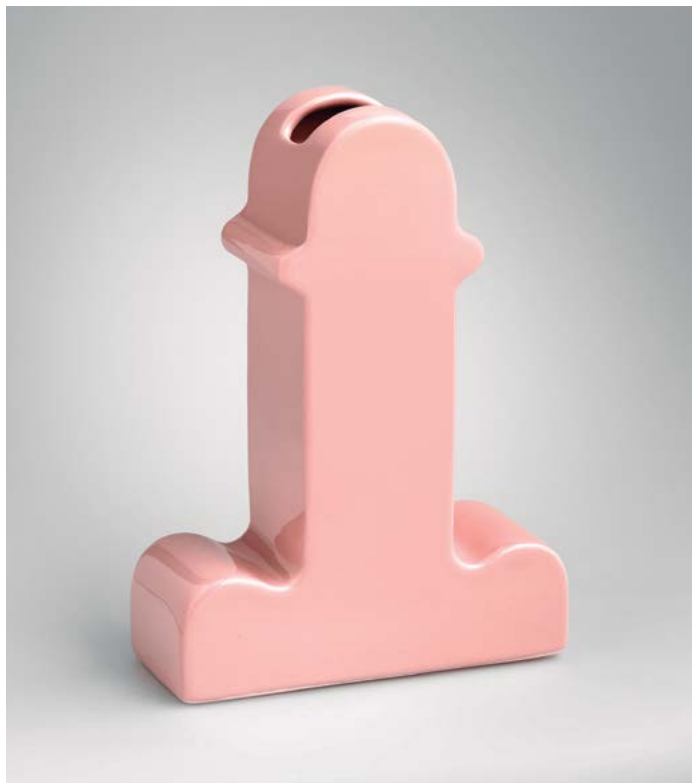
Ettore Sottsass (dissenyador) i BD Barcelona (producció). Sbiva 1973 (2021) Gerro, s/m. 23 x 17 x 7 cm. Museu del Disseny de Barcelona; MDB 14048.