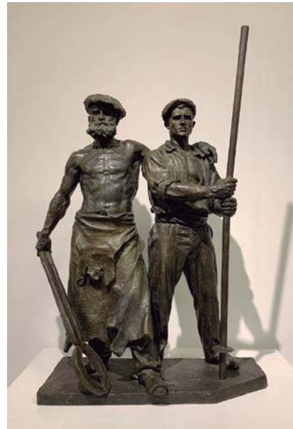
Miquel Blay Barrinaire i fonedor 1903 (Fragment del Monument a Víctor Chávarri , Portugaleta) Fosa en bronze 116 x 86 x 38 cm. Museu de la Garrotxa, Olot, núm. d'inventari 2511.