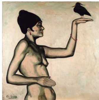
Marisa Roësset Repòs

1915 Oli sobre tela 84 x 86,7 cm. Biblioteca Museu Víctor Balaguer, Vilanova i la Geltrú; núm. de registre 2490. (Obra no exposada).