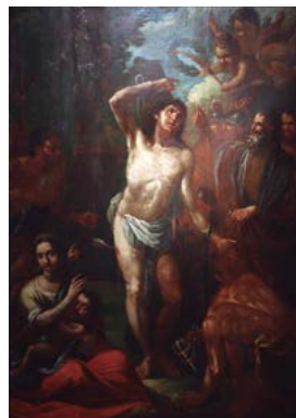
Fra Joaquim Juncosa El Martiri de Sant Sebastià Cap a 1689 Oli sobre tela 198 x 139 cm. Fons de l'Institut Municipal dels Museus de Reus. Museu de Reus, MR 2072. (Obra no exposada).