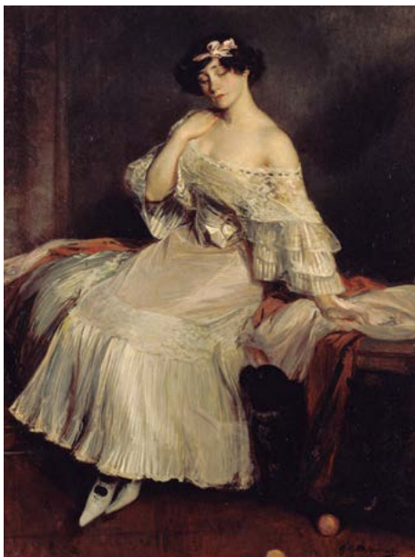
Jacques-Émile Blanche Retrat de la novel·lista Colette

Cap a 1905 Oli sobre tela 158 x 118 cm. Museu Nacional d'Art de Catalunya, adquisició a la «V Exposició Internacional de Belles Arts i Indústries Artístiques» de Barcelona, 1907.