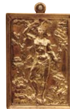
Medalla amb Sant Sebastià Castella Segle XVII Bronze daurat i cisellat Museu d'Art Medieval, Vic. MEV 4556.