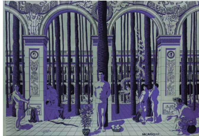
Nazario San Sebastián y los centauros (Alegoría del SIDA) 1999 Serigrafia sobre tela 95 x 135 cm. Dipòsit Generalitat de Catalunya. Col·lecció Nacional. Museu d'Art de Cerdanyola. © Nazario, VEGAP, Barcelona, 2023. (Obra no exposada).