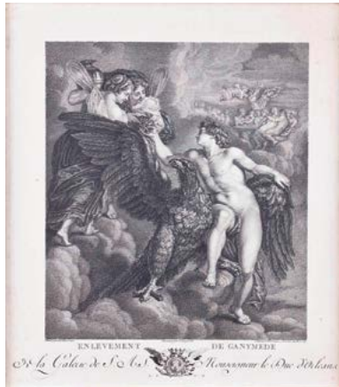
Benoît-Louis Henriquez El rapte de Ganímedes, segons Rubens Cap a 1786 Buri 25,4 x 22,1 cm. Fons Gelonch-Viladegut. Museu de Lleida. (Obra no exposada).