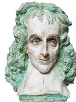
Ismael Smith. Personatge literari , 1932. Museu Nacional d'Art de Catalunya

Aquesta performance vol mostrar, mitjançant el voguing , la bellesa a través de la monstrositat, inspirant-se en l'excés i la imatgeria al voltant de la figura d'Ismael Smith, i retratar la lluita interna de moltes